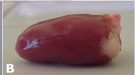
Cœur de poulet en l'état

A (face ventrale) : oreillettes absentes, départ de l'artère aorte en haut