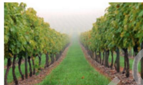
a. Bandes enherbées entre des rangées de vigne

Les végétaux limitent le ruissellement en retenant l'eau (les feuilles freinent les gouttes et les racines favorisent son infiltration). Lors d'une érosion causée par des vents forts, le couvert végétal protège le sol en maintenant une couche d'air immobile proche du sol. De plus, les racines donnent de la cohésion au sol, limitant aussi l'érosion.