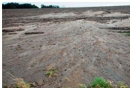
Ruissellement de l'eau et érosion du sol